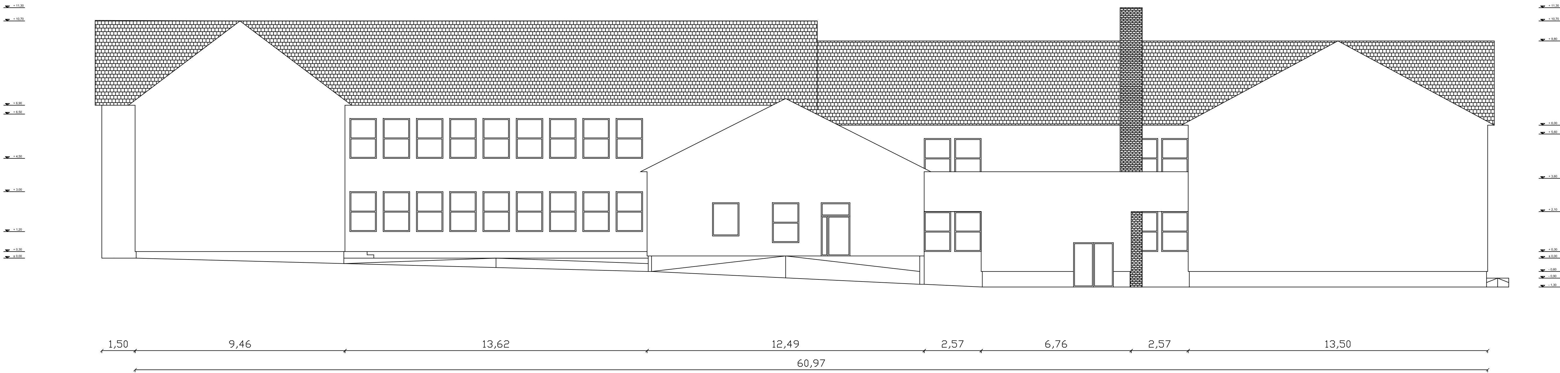
DÉLI HOMLOKZAT M=1:100 (meglévő állapot)